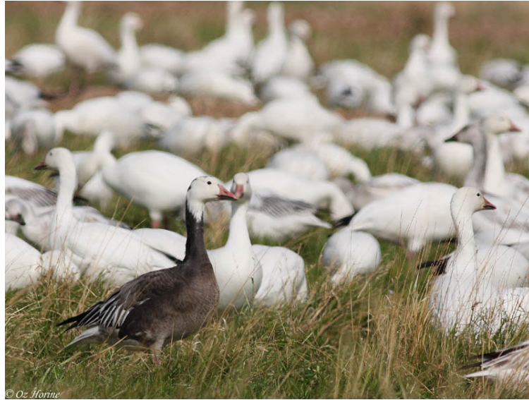
המופע הכחול (blue-morph) של אווז השלג

הפתעה נעימה על עמוד חשמל בין השדות - Prairie Falcon, ענק, כמו בז ציידים שלנו. והספר ממשיך ומסביר לאיזו רפת להגיע, ולסרוק, ואחרי כמה שורות של אלפי פרות המוקפות באלפי Red-winged Blackbird אכן נמצאו גם Yellow-headed Blackbird אחדות.