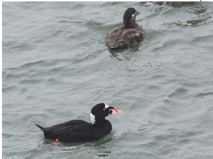
© Oz Horine Surf Scoter – קטיפנית משברים

המזח שחודר לים Huntington Beach Pier (חניה בתשלום ממכונות שלא מחזירות עודף!) משמש תצפית מצויינת לעשרות גולשי גלים, והניב להקה כמה עשרות קטיפניות משברים (Surf Scoter), ותצפית מטווח אפס בשנקאי חום ובמספר מיני שחפים.