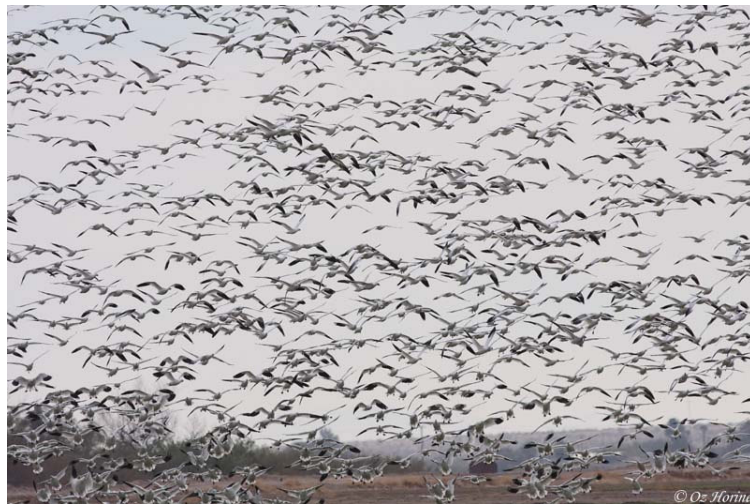
Snow Goose (אווזי שלג)