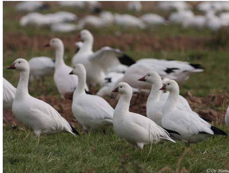
הקרובים מימין Ross's Goose, ומסביבים אלפי Snow Goose (אווזי שלג)

אזור מיוחד, שבו גם להקות עצומות של אווזי שלג, הוא Sonny Bono Salton Sea National Wildlife Refuge. כאן גם הצלחתי למצוא ביניהם מספר אווזי רוס (Ross's Goose). אווזי הרוס נבדלים במקורם הקצר יותר, בראש מעוגל, צואר קצר יחסית ובהעדר הפס הכהה בתחתית המקור.